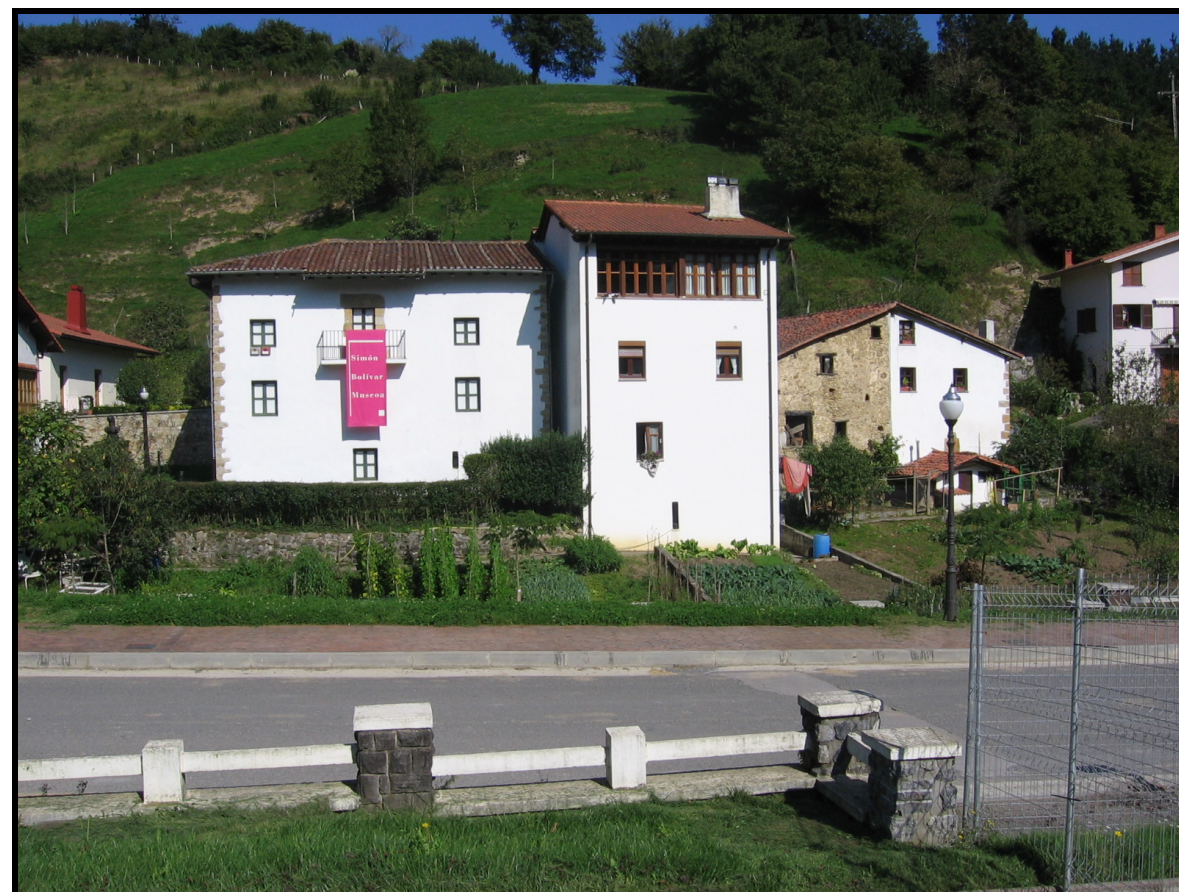
Simon Bolivar Museoa